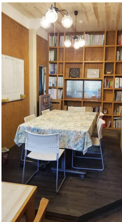
つどいの部屋 & 会議室